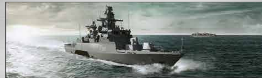
K 130 (embarcaciones 6 a 10) Clase Köln Corbetas En construcción

Sea cual sea el requisito o el presupuesto, somos flexibles y ofrecemos soluciones navales a medida a partir de un único origen. La amplitud de nuestra experiencia queda demostrada a través de nuestra cartera, que abarca desde embarcaciones rápidas de patrulla y buques de patrulla en altamar hasta corbetas, fragatas, embarcaciones dragaminas y barcos de apoyo logístico.