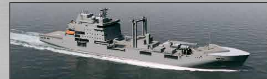
MBV 707 Buques de aprovisionamiento logístico En construcción