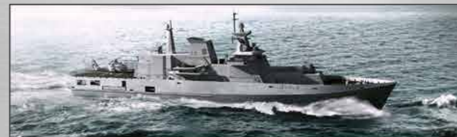
MMPV90 Corbetas En construcción