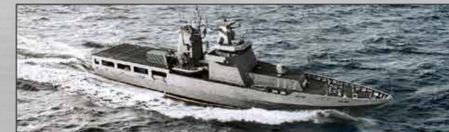
SEA 1180 Clase Arafura Embarcaciones de patrulla en altamar En construcción