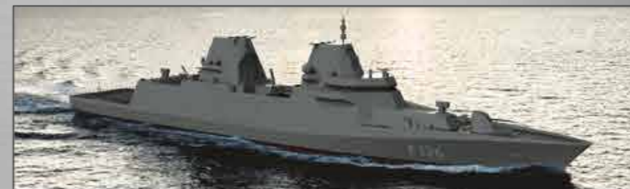
F 126 Fragatas (como subcontratista) En construcción